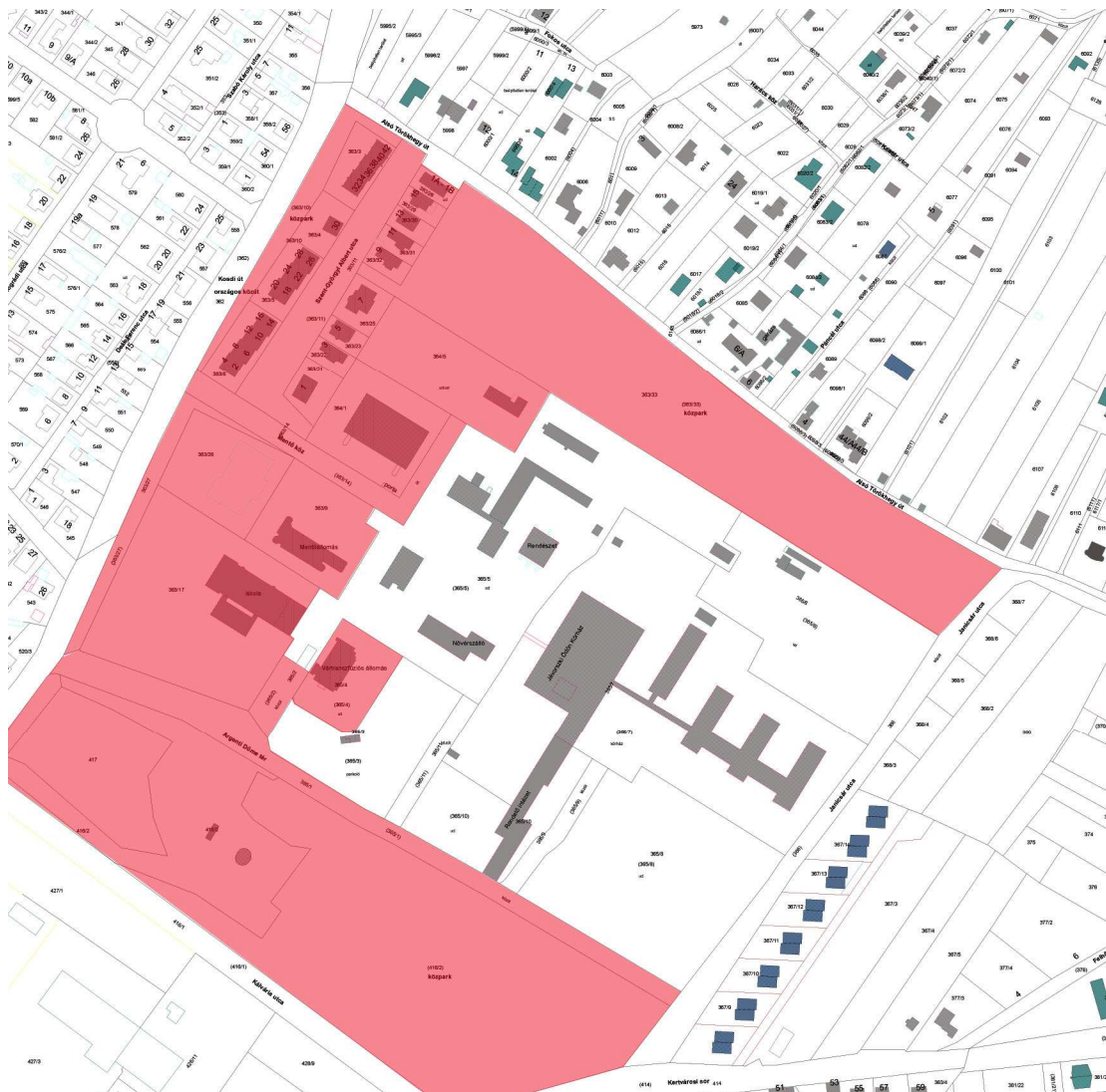
kiemelt fejlesztési terület lehatárolása