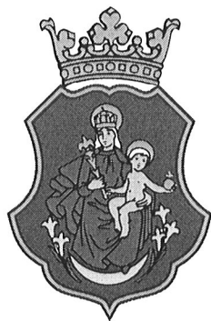
A város címere