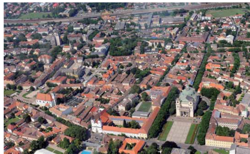
A HÓNAP FOTÓJA