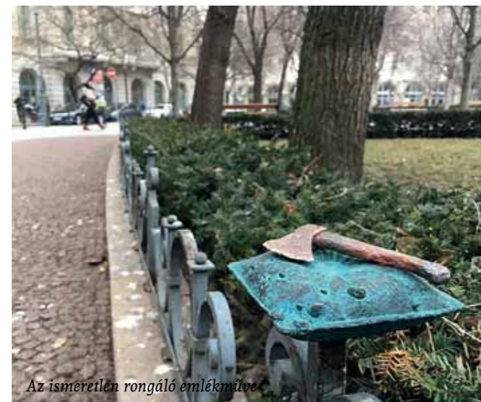
Az ismeretlen rongáló emlékműve