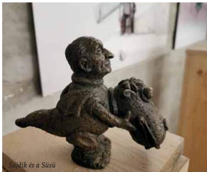
Sajdik és a Süsü