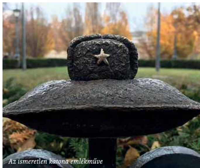
Az ismeretlen katona emlékműve