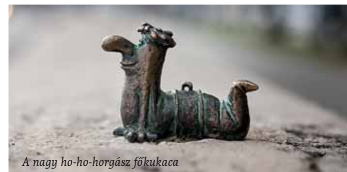
A nagy ho-ho-horgász főkukaca

De hogy került épp Vácra ez a fiatal művész festő művész feleségével és két apró kislányával?