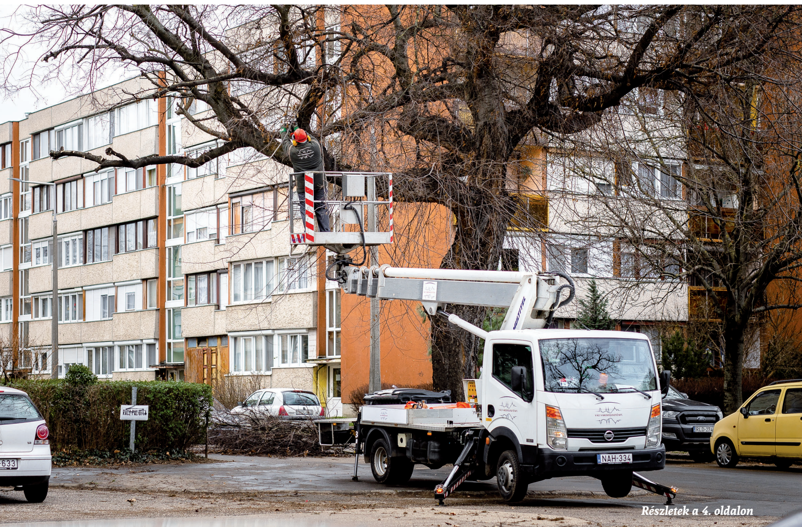
Részletek a 4. oldalon