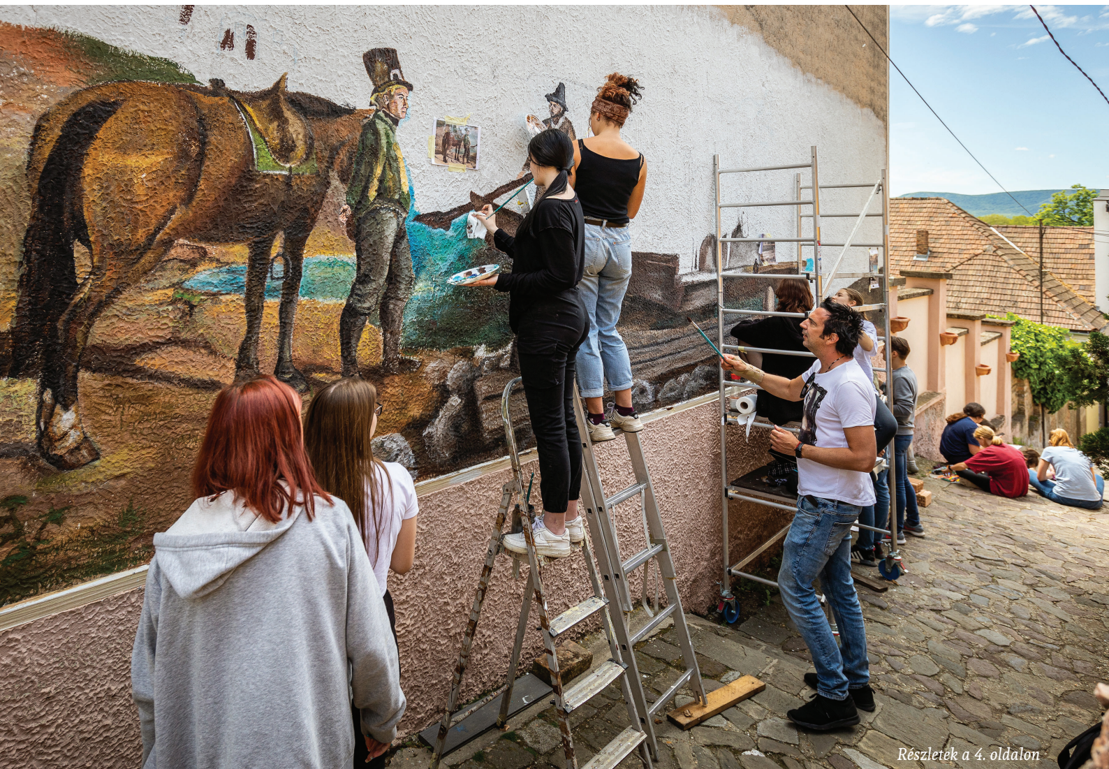
Részletek a 4. oldalon