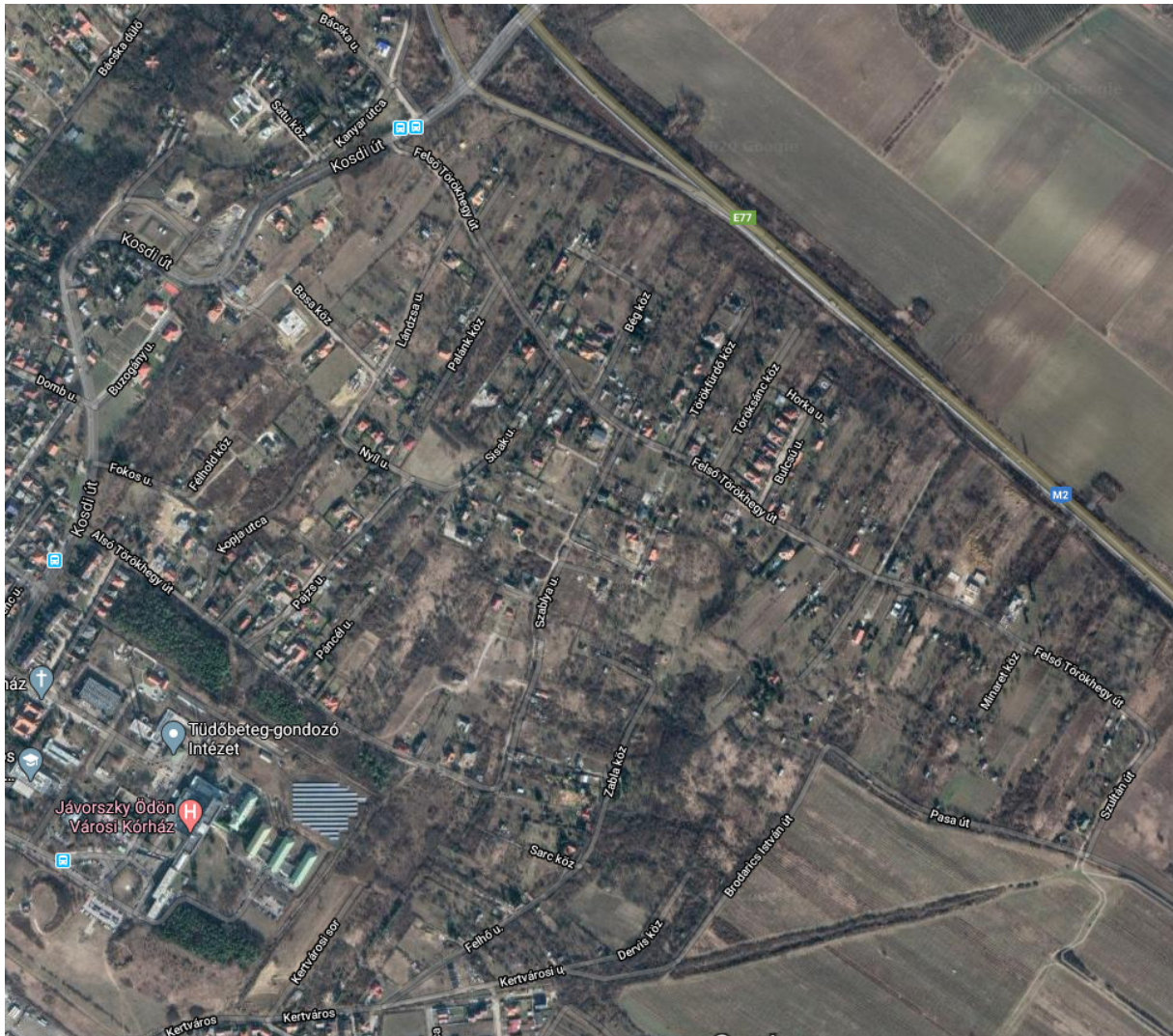
a terület műhold képe

Az adott területet az intézményi, településközponti, kereskedelmi építési övezetek, valamint a tervezett zöldövezetek hiánya jellemzi.