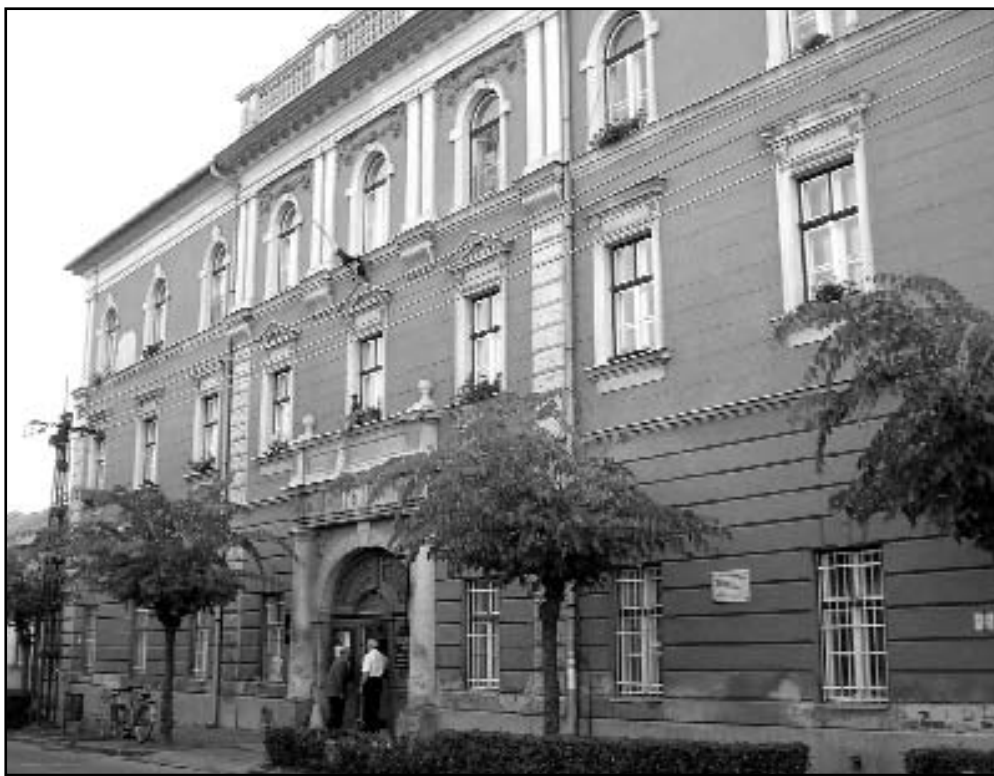
Helyi védelmet élvez a volt buszárlaktanya, a jelenlegi könyvtáreépület

Elkészült a helyi védett épületek törzskönyve, amely az alkotók szándéka szerint, folyamatosan bővíthet.