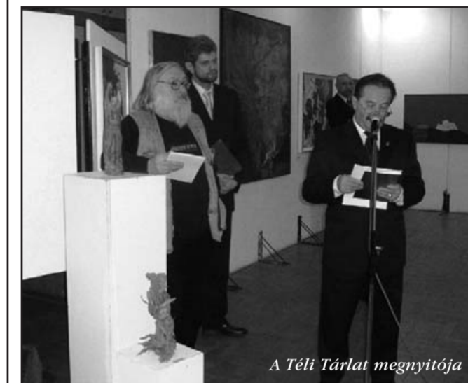
A Téli Tárlat megnyitója

A hagyományoknak megfelelően, decemberben rendezték meg a Téli Tárlatot, Vác és környéke képzőművészeinek reprezentatív kiállítását, amelyet a város polgármestere nyitott meg. A bemutatott alkotásokat és alkotókat dr. Ham Ferenc művészettörténész méltatta, s a megnyitón a Radnóti Miklós Általános Iskola diákjai működték közre. A Téli Tárlat alkalmából, Áramlatok címmel, színes katalógust jelentetett meg Vác önkormányzata, amely a város és környéke képző- és fotóművészeit mutatja be.