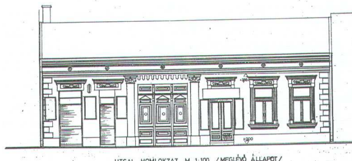
UTCAI HOMLOKZAT M 1:100 / MEGLEVŐ ÁLLAPOT /