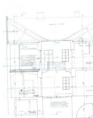
B-B METSZET M 1:50