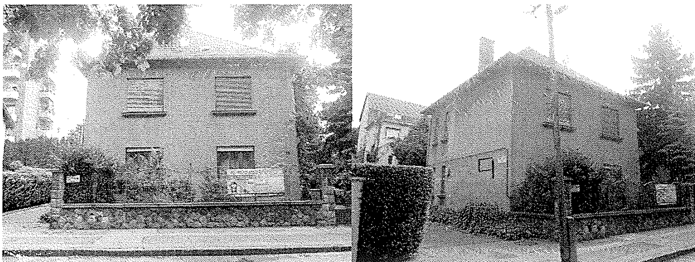
Liszt F. sétány 15.

Az emléktábla a Liszt Ferenc sétány 15. számú ház falán kerülne kihelyezésre az alábbi fotó alapján, a közterületek elnevezéséről, azok jelöléséről és a házszámozás rendjéről, valamint egyéb elnevezésekről szóló 46/2012. (XI.23.) számú önkormányzati rendelet 7. számú függelékében foglalt ajánlásnak megfelelően.