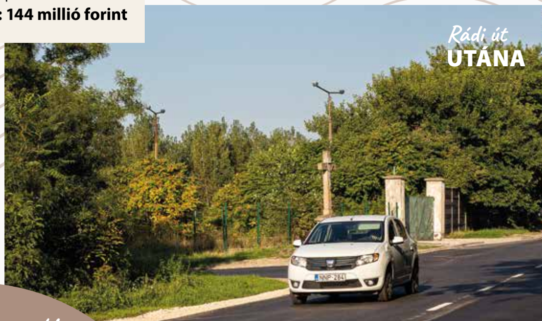
Rádi út UTÁNA