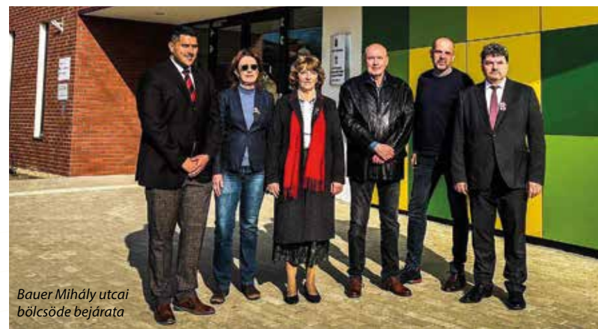
Bauer Mihály utcai bölcsőde bejárata

A jelenlegi városvezetés a kezdetektől kiemelt figyelmet fordít arra, hogy a váci gyermekek a lehető legjobb körülmények között sajátíthassák el az iskolakezdéshez szükséges alapokat. 2020 és 2023 között minden évben több pénzt költött a város óvodái és bölcsődéi felújítására, fejlesztésére, mint az előző városvezetés négy teljes évében összesen. Nincs olyan önkormányzati gyermekintézmény, amely ne újult volna meg az elmúlt évek során. Játsszószoza, konyha kialakítása, kültéri játékok felújítása és beszerzése mellett az épületek korszerűsítésére is jutott a városkasszából.