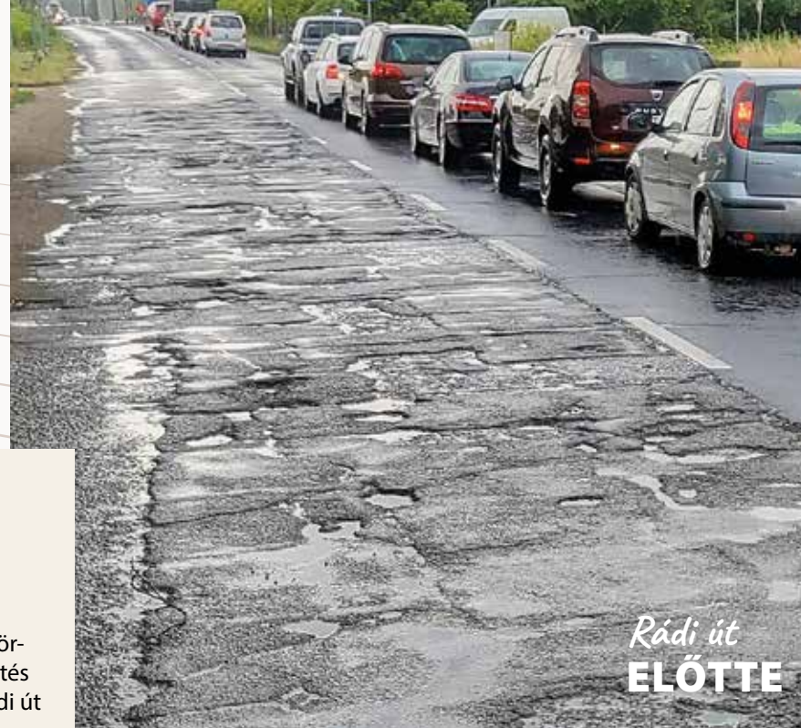
Rádi út ELŐTTE