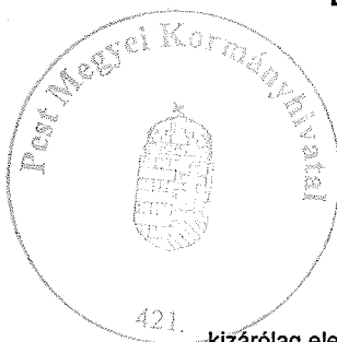
Urbán Judit ügyintéző