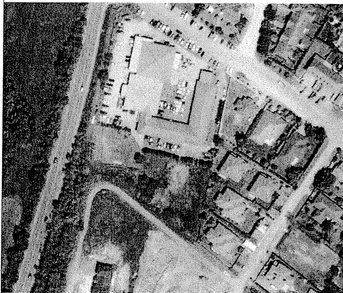
GOOGLE MŰHOLDAS HELYSZÍN