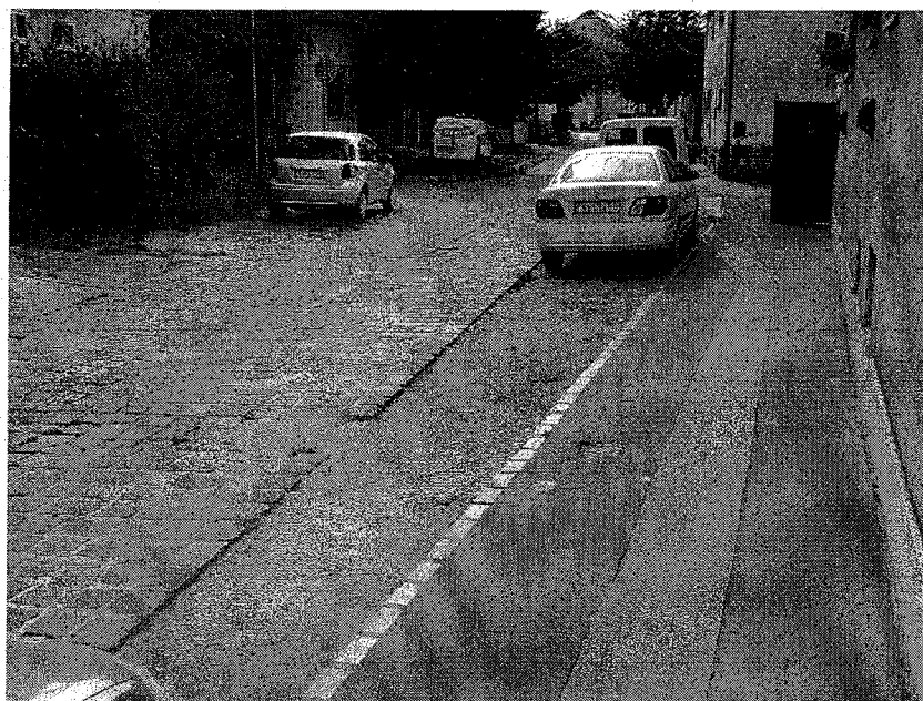
Tabán utca 40-42. előtti terület