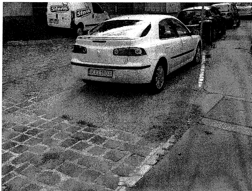
Tabán utca 38. előtti terület